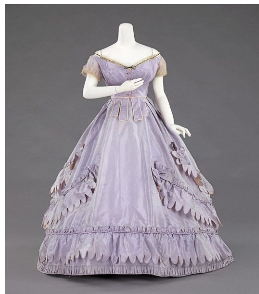
Robe di serrata 1862

Estratto da : « Le mattine italiane, rivista aneddotica, artistica e letteraria » - Florence, 1868