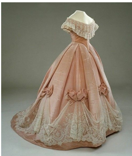
Robe de bal 1860

Si au contraire vous n'avez pas le don de lui plaire, il se bornera à recevoir votre commande avec un flegme tout britannique, il la fera inscrire, sans un mot de compliment, sans un avis ou un conseil, il vous reconduira poliment jusqu'au seuil. L'inspiration lui aura manqué.