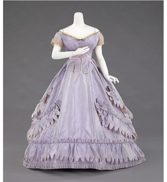
Robe de soirée 1862

Je fais en ce moment même une réflexion égoïste et empreinte d'épouvante : Si Worth vient à se retirer, où nous habillerons-nous grand Dieu ? »